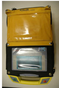
FRED (l'ancien) Ambulances « AMU »