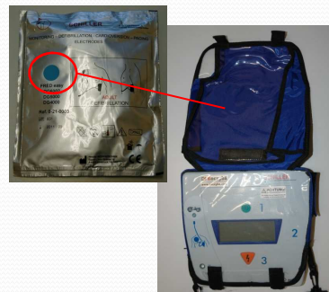
FRED Easy (le nouveau) Ambulance « Feu »