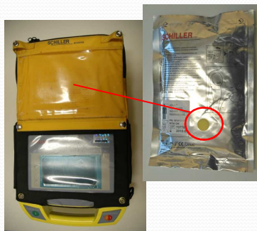
FRED (l'ancien) Ambulances « AMU »